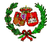
CONSEJO GENERAL DE PROCURADORES