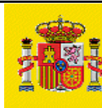
FISCALÍA GENERAL DEL ESTADO